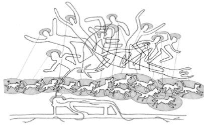
Kuva 3: http://www.bumblenut.com/drawing/art/plateaus/index.shtml

1960-luvulla Suomen yhteiskuntapolitiikassa rohjettiin ajatella suuria. Yksi ”suuren ajattelun” tulos oli peruskoulu. Tänäpä koulutuspolitiikassa tarvittaisiin vastaavaa ”suurta ajattelua”, peruskoulun päivitettyä versiota, joka perustuisi olennaiselta osaltaan wikipedagogiikan hyödyntämiseen, tai itse asiassa niiden oppimiskäytäntöjen oikeuttamiseen (legitimointiin) ja näkyväksi tekemiseen, jotka ovat monille opettajille ja opiskelijoille tuttuja muodollisen koulutuksen ulkopuolella (harrastuksista, itseopiskelusta, kuluttamisesta, viihteellisestä toiminnasta ja kansansivistyksen alueelta). Lyhyesti: tietoyhteiskunnasta (sellaisena kuin se meille 90-luvun propagandassa esiteltiin) on siirrytty osallistumisen kulttuuriin, jossa oppiminen perustuu entistä enemmän vertaisilta ja yhdessä oppimiseen ilman ikärajoituksia, tutkintoja ja oppikirjoja. Kouluoppiminen (luen mukaan myös korkeakouluoppimisen) sellaisena kuin se meille stereotyyppisesti esittyy, on osallistumisen kulttuurin sosiaalistuneiden kannalta yhä vieraampi tapa käsittää oppiminen.